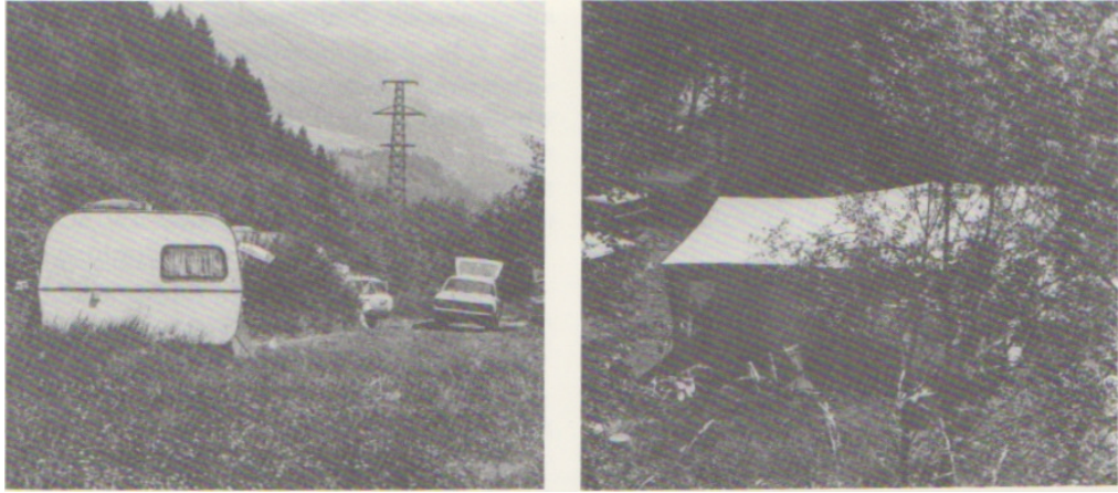
Auf diesem Platz am Rhein hinter Ilanz verbrachten jenische Familien einige Sommerwochen.

H. Bertogg beschreibt die Fahrt der Jenischen, die ihr Winterquartier in Graubünden hatten, wie folgt: «Ihre Tour de Suisse geht im März durchs Rheintal hinunter. Der erste grosse Aufenthalt erfolgt um Sargans herum. Da treffen sich offenbar die verschiedenen Sippen, um nach den Wiedersehensfeierlichkeiten teils dem Walensee nach, teils dem Rhein entlang zu ziehen. Dorf für Dorf wird dabei ein Stück weit mit eingehendem Besuch beglückt. Dann erfolgt dazwischen immer wieder ein Gewaltmarsch durch ein ganz unberührtes Gebiet. Wichtige Stationen sind die Gegend um St. Margrethen für die Rheinfahrer, das Gasterland für die Westwanderer, auffälligerweise immer Gebiete der alten Untertanenlande und ehemalige Vogteien oder eben die günstigen "Dreiländerecken". Nach Abstechern ins Zürcher Oberland und nach der Anstandsvisite in der Stadt Zürich verziehen sie sich gegen den ersten August herum als gute Schweizer aus dem Solothurnischen in die Urschweiz, um vor Wintereinbruch fett und wohlversehen über die Oberalp den Heimatkanton aufzusuchen.» (Aus dem Leben der Bündner Vaganten.) Der Aufbruch im Frühling wird vor allem durch die Wärme bestimmt. Auch sesshafte Jenische klagen im Frühling am meisten darüber, dass sie nicht fahren können.