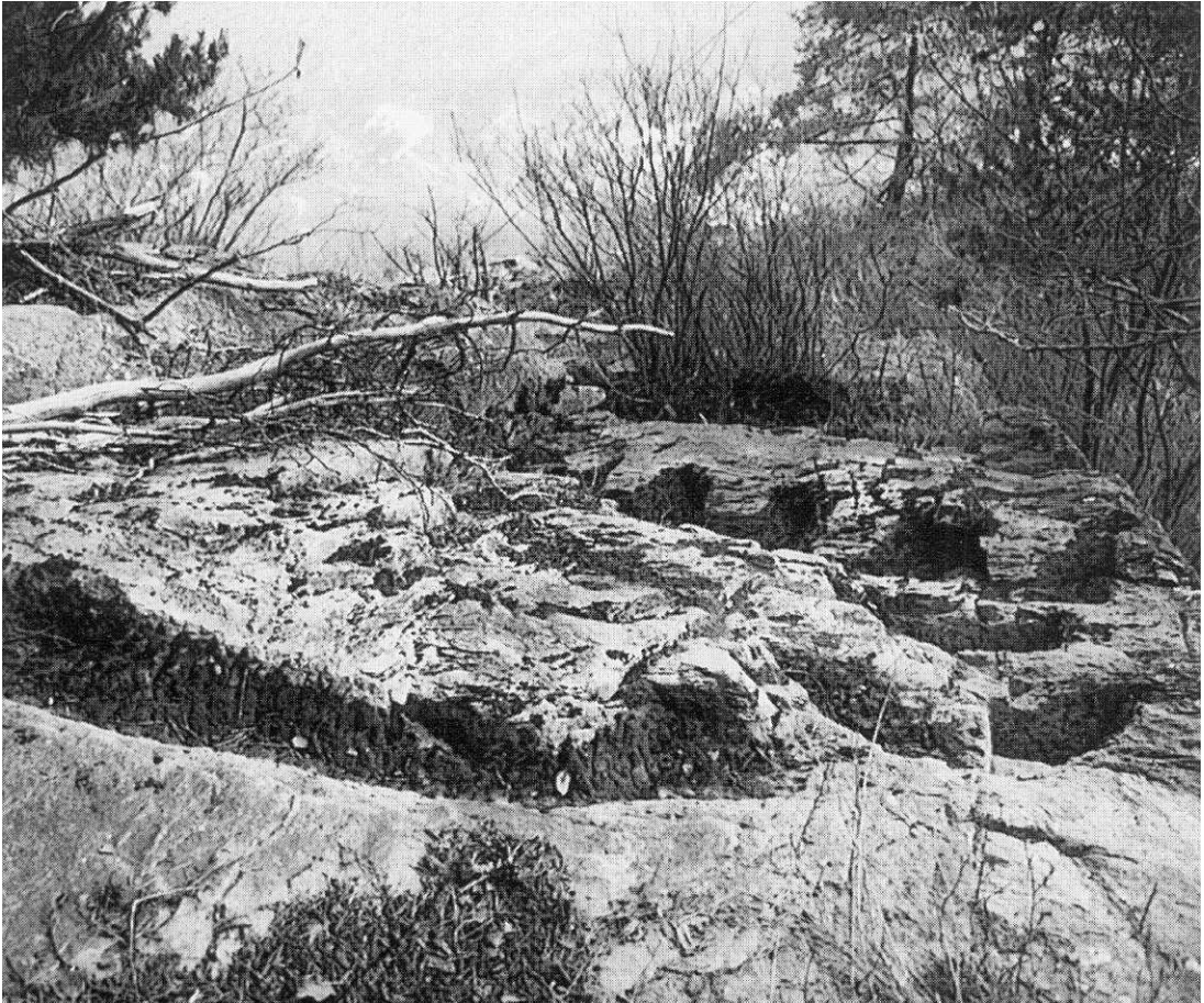
Schwindelerregender Blick über die Felskerbe und die Trittstufen bei «Scalaripp» hinunter zum Rhein.

überwinden, eine bei «Scalaripp», eine südlich «Chälchli» und in vermindertem Masse jene beim «Oldishus».