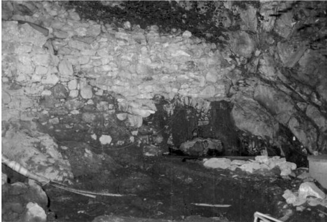
Detail der Ausgrabungen (Fussboden beim Eingang des alten Gebäudes)